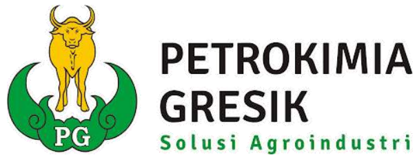
Gambar 1.4 Logo PT. Petrokimia

Logo perusahaan PT Petrokimia Gresik dapat dilihat pada gambar 1.4.