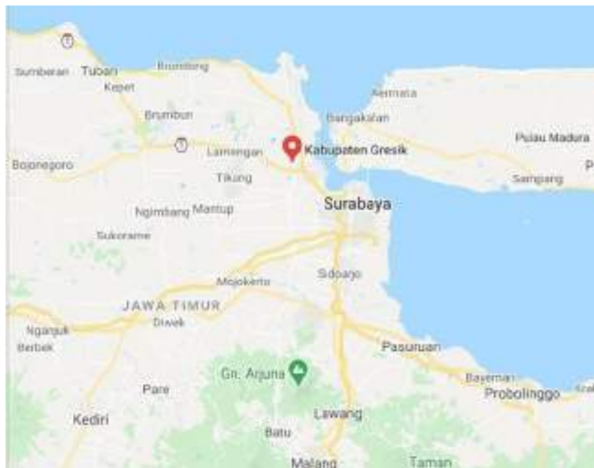
Gambar 1.1 Peta lokasi Kabupaten Gresik

Peta lokasi Kabupaten Gresik dan PT. Petrokimia Gresik dapat dilihat pada gambar 1.1 dan gambar 1.2.