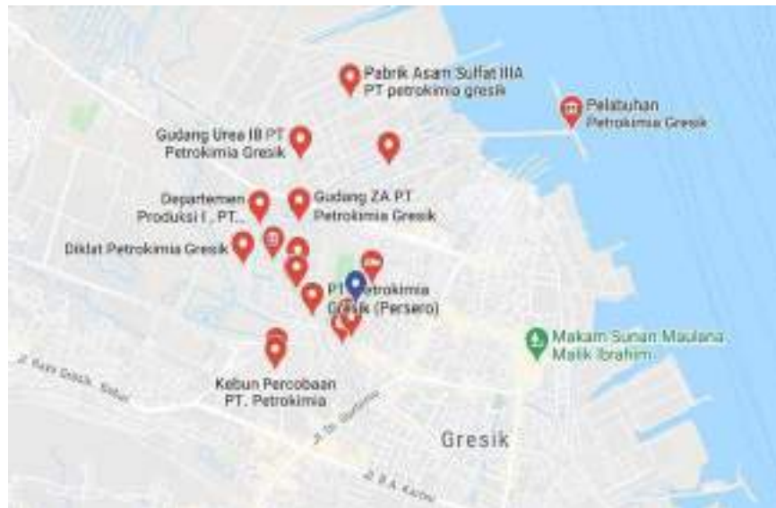
Gambar 1.2 Peta lokasi PT. Petrokimia Gresik

Plant layout PT Petrokimia Gresik dapat dilihat pada gambar 1.3.