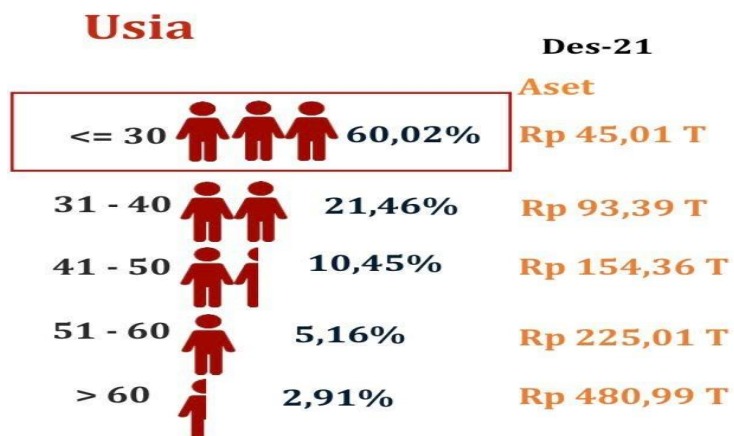
Gambar 1.2 Pertumbuhan minat investasi generasi muda

Desember 2021 menunjukkan bahwa terdapat peningkatan jumlah investor yang didominasi oleh investor domestic yang memiliki rentang umur di bawah 30 tahun yang mencapai sekitar 60,02 % dengan jumlah asset sebesar 45,01 Triliun. Kemudian di susul oleh 21,46% jumlah investor dengan rentan usia 31-40 tahun dengan jumlah asset sebesar 93,39 Triliun. Berdasarkan data tersebut menunjukkan bahwa minat dalam melakukan investasi di Indonesia dalam beberapa tahun terakhir ini cenderung di dominasi oleh kaum muda yang berumur 30 tahun ke bawah. Hal tersebut di sebabkan oleh beberapa faktor seperti pengetahuan yang cukup tentang investasi dan teknologi informasi yang semakin berkembang.