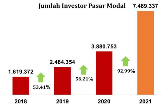
Gambar 1.1 Data Statistik Pertumbuhan Investor