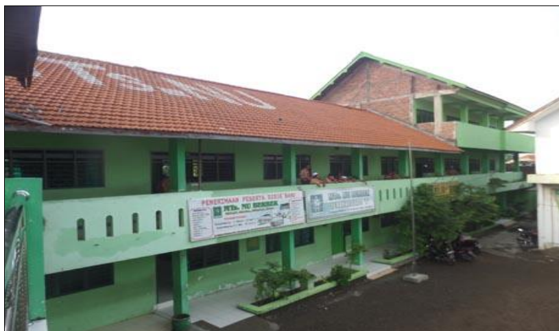
Gambar 2. 1 Sekolah MTs. NU Berbek Sidoarjo

MTS NU Berbek adalah sebuah Madrasah Tsanawiyah swasta dibawah naungan yayasan BPPNU yang berlokasi di Jln. Brigjend. Katamso No.170, Berbek, Waru, Sidoarjo. MTS NU Berbek sendiri sudah terkenal sebagai salah satu Madrasah swasta unggulan yang ada di Kecamatan waru dengan status Akreditasi A sejak 03 Nopember 2011. MTS NU Berbek ini sudah berdiri sejak tahun 1995 dan telah mempunyai Nomor Statistik Madrasah (NSM) dan Nomor Pokok Sekolah Nasional (NPSN).