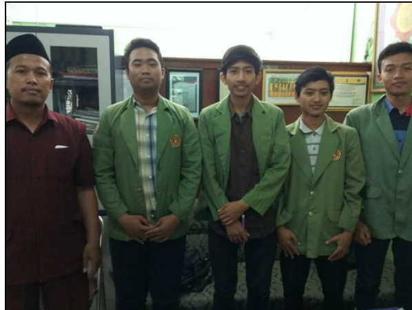
Gambar 2. 2 Dokumentasi bersama Kepala Sekolah MTs. NU Berbek Sidoarjo

Dokumentasi selama pengerjaan PKL di sekolah MTs. NU Berbek Sidoarjo: