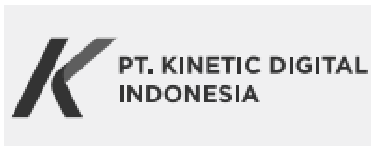
Gambar 2.1 Logo PT. Kinetic Digital Indonesia

Logo PT. Kinetic Digital Indonesia diatas memiliki makna dan arti logo perusahaan dapat dijelaskan sebagai berikut: