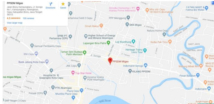
Gambar I. 1 Peta Lokasi PPSDM Migas Cepu

Pusat Pengembangan Sumber Daya Manusia Minyak dan Gas Bumi berlokasi di Jalan Sorogo 1, Kelurahan Karangboyo, Kecamatan Cepu, Kabupaten Blora, Provinsi Jawa Tengah, Kode pos 58315. Luas area sarana dan prasarana seluas 129 hektar.