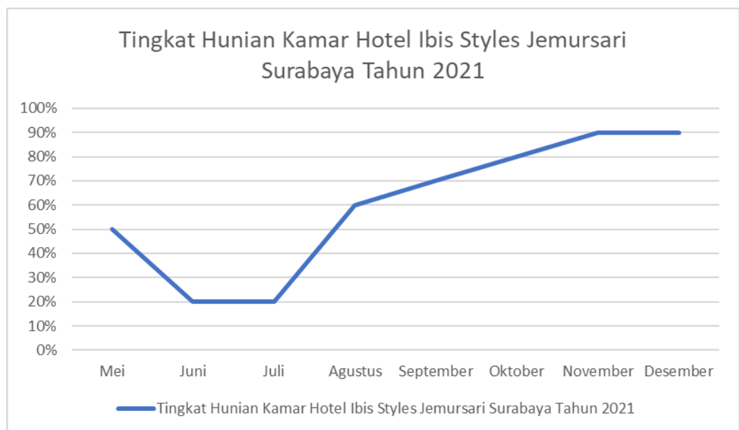
Gambar 1.2 Tingkat Hunian Kamar Hotel Ibis Styles Jemursari Surabaya Tahun 2021

dengan kapasitas 10% dari kapasitas biasanya dan memberlakukan protokol kesehatan secara ketat. Lalu, diberlakukan PPKM Level 3 yaitu terdapat kelonggaran dan hal ini menjadi kesempatan yang baik bagi hotel untuk menyusun strategi marketing agar bisa bangkit kembali dari keterpurukan.