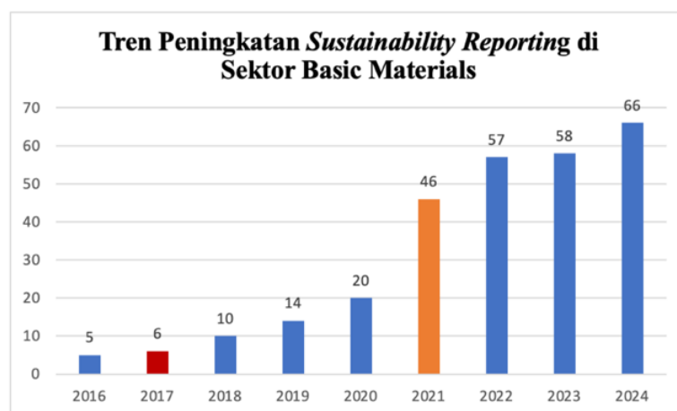
Gambar 1.1 Perusahaan Di Sektor Basic Materials yang Menerbitkan Sustainability Reporting 2016-2024

Kedua peristiwa tersebut merupakan bentuk nyata alasan dari pentingnya pengungkapan sustainability report sebagai bentuk tanggung jawab perusahaan terhadap lingkungan dan sosial. Sejalan dengan urgensi tersebut, pemerintah melalui Otoritas Jasa Keuangan menetapkan PJOK No. 51/PJOK.03/2017 yang mendorong peningkatan praktik sustainability reporting dengan mewajibkan lembaga jasa keuangan, emiten dan perusahaan publik untuk menyusun laporan keberlanjutan (POJK 51, 2017). Penerapan POJK tersebut diperkuat melalui diterbitkannya SEOJK No. 16/SEOJK.04/2021 yang memberikan panduan teknis bagi emiten dan perusahaan publik dalam menyusun laporan keberlanjutan (SEOJK 16, 2021).