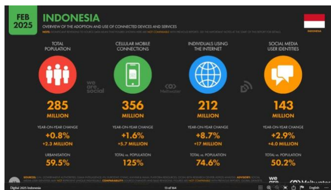
Gambar 1.1 Jumlah Pengguna Media Sosial Indonesia

Terdapat perbedaan yang cukup signifikan apabila membandingkan Tiktok dengan media sosial lainnya. Tiktok memiliki keunikan tersendiri, selain rata-rata konten yang tersedia merupakan video berdurasi pendek, Tiktok bahkan memiliki istilah tersendiri yaitu For You Page atau lebih dikenal dengan sebutan FYP. FYP akan muncul seketika pengguna membuka aplikasi Tiktok, merujuk pada halaman yang memang disediakan oleh Tiktok dalam menemukan konten-konten yang disarankan untuk para penggunanya (Kosmos & Pebriyanti, 2024).