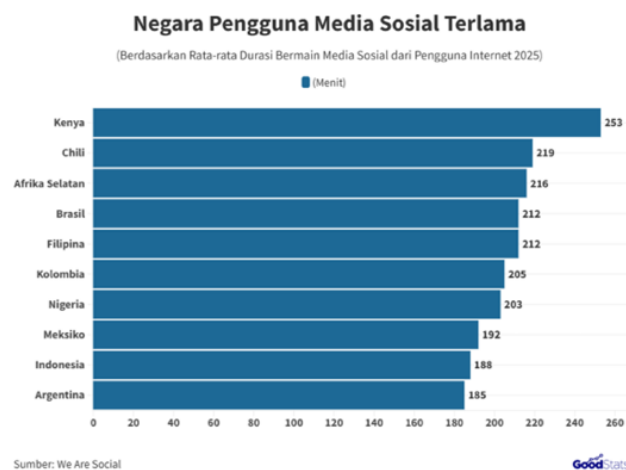
Gambar 1. 2 Grafik Durasi Pengguna Media Sosial 2025

Menurut riset We Are Social dalam unggahan akun Instagram @dataindonesia_id, Indonesia merupakan salah satu negara yang memiliki jumlah pengguna media sosial Tiktok terbanyak dengan jumlah 107,69 juta jiwa per Januari 2025. Posisi pertama negara dengan jumlah pengguna Tiktok terbanyak dikuasai oleh Amerika Serikat dengan total jumlah pengguna media sosial Tiktok sebanyak 135,69 juta jiwa. Kemudian diikuti pula oleh Brazil yang menempati posisi ketiga setelah Indonesia yakni terdapat 91,75 juta jiwa sebagai pengguna media sosial Tiktok.