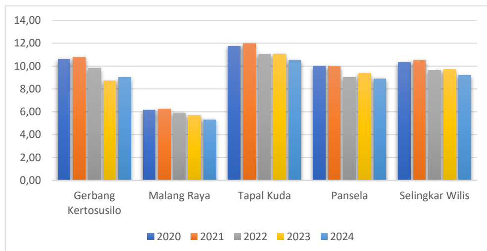
Gambar 1. 1 Tingkat Kemiskinan Wilayah Provinsi Jawa Timur Tahun 2020-2024

Sumber: Badan Pusat Statistik, 2025 (diolah)