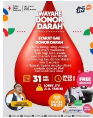
Gambar 2.26. Poster Donor Darah

Donor Darah merupakan event yang diadakan oleh PT. Jawapos Media Televisi (JTV) . Di mana masyarakat dapat berpartisipasi dalam kegiatan donor darah. Event ini terbuka untuk umum dengan memenuhi sejumlah persyaratan yang telah ditentukan.