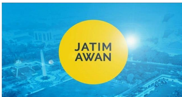
Gambar 2.5. Logo Program Jatim Awan

Jatim Awan merupakan program berita harian yang menyajikan informasi terbaru di Jawa Timur dengan mengedepankan konsep berita soft news. Jatim Awan disiarkan secara live setiap hari senin hingga sabtu, dengan jam tayang pukul 11.30 - 12.00.