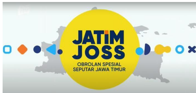
Gambar 2.19. Logo Jatim Joss

Jatim Joss merupakan program liputan inspiratif tentang keberhasilan, inovasi, dan potensi di Jawa Timur. Program ini menyoroti kisah sukses pelaku usaha, perkembangan daerah, serta kegiatan kreatif masyarakat yang membanggakan Jawa Timur.