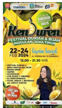
Gambar 2.25. Poster Festival Duren

Kenduren merupakan event yang diadakan oleh PT. Jawapos Media Televisi untuk merayakan dan melestarikan tradisi kuliner serta budaya Jawa Timur. Acara ini biasanya melibatkan berbagai kegiatan, seperti festival makanan, bazar, dan pertunjukkan seni yang menggambarkan kekayaan budaya lokal.