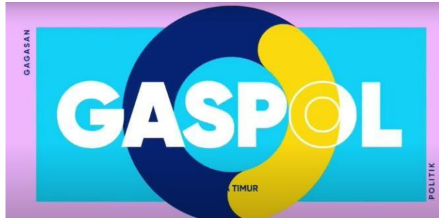
Gambar 2.20. Logo GASPOL

Jatim Gapol merupakan program yang membahas topik aktual di Jawa Timur, seperti ekonomi, budaya, dan infrastruktur. Program ini menampilkan narasumber dari berbagai bidang melalui diskusi interaktif atau liputan mendalam, menghadirkan perspektif lokal khas Jawa Timur.