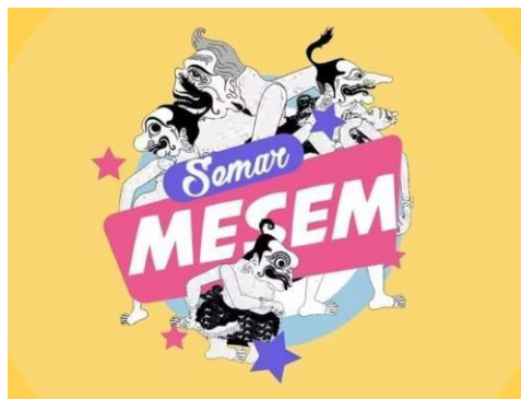
Gambar 2.15. Logo Semar Mesem

Semar Mesem merupakan program komedi yang diperankan oleh komedian-komedian muda dengan karakter “Punakawan” yaitu Semar, Petruk, Gareng dan Bagong, dan hadirnya penyanyi tiap sketsanya. Mengetengahkan cerita pewayangan yang berkait erat pesan moral masyarakat melalui balutan komedi. Menjadikan memiliki nilai Semar Mesem. Semar mesem tayang setiap hari jumat pukul 18.00 - 19.00.