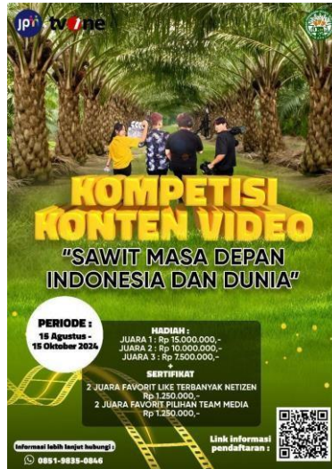
Gambar 2.24. Poster Kompetisi Konten Video Sawit

Kompetisi konten video sawit merupakan event untuk mengajak generasi muda dan masyarakat menuangkan ide, pandangan dan harapan terhadap industri sawit serta mendorong kesadaran adanya kebutuhan Indonesia memiliki perkebunan sawit, sebagai penopang ekonomi Indonesia dan membuka lapangan kerja