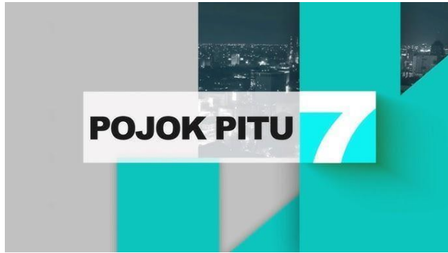
Gambar 2.9. Logo program pojok pitu

Pojok pitu merupakan program harian yang menyajikan informasi terbaru, terhangat dan teraktual yang terjadi di Jawa Timur. Pojok pitu merupakan kumpulan berita-berita pilihan dan terbaik yang dikemas secara apik dalam sebuah program berita. Pojok pitu ditayangkan setiap hari senin hingga sabtu, dengan jam tayang pukul 19.00 - 20.00.