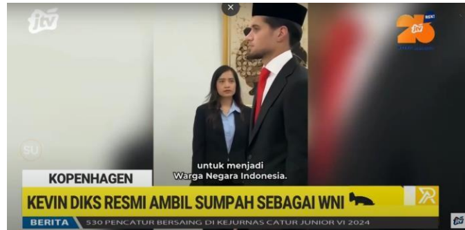
Gambar 2.12. Tampilan Program Arena

cabang olah raga populer di dunia. Pojok Arena disiarkan secara live yang menyajikan peristiwa dan informasi seputar olahraga di Jawa Timur. Pojok Arena dikemas ringan dan segar. Pojok Arena disiarkan setiap hari senin hingga sabtu, dengan jam tayang pukul 09.00 - 09.30.