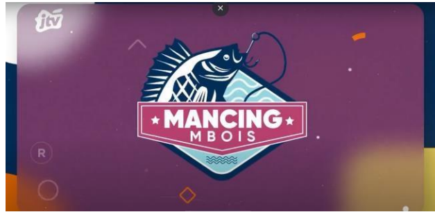
Gambar 2.18. Logo Mancing Mbois

Mancing Mbois merupakan program hiburan yang mengajak penonton menikmati kegiatan memancing di berbagai lokasi menarik di Jawa Timur. Program ini menampilkan keindahan alam sekitar, teknik memancing. Dengan gaya santai dan humor khas Jawa Timur-an.