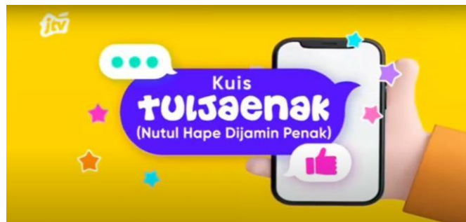
Gambar 2.23 Tampilan Tul Jaenak

Kuis Tul Jaenak merupakan program kuis 5 menit yang disiarkan langsung. Program ini menghadirkan kuis interaktif dengan nuansa khas Jawa Timur. Kuis Tul Jaenak mengajak penonton untuk berpartisipasi menjawab pertanyaan menarik seputar, budaya, tradisi, dan kehidupan sehari-hari masyarakat Jawa Timur.