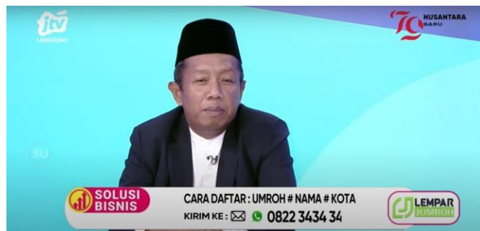
Gambar 2.21 Tampilan Solusi Sehat

Solusi Bisnis merupakan program yang membahas mengenai dunia usaha dan peluang bisnis, memberikan wawasan, tips, serta strategi pengembangan usaha. Program ini sangat relevan sebagai referensi bagi pengusaha dan masyarakat dalam menemukan peluang untuk meraih keuntungan. Solusi Bisnis tayang secara langsung setiap Senin, Kamis, Jumat, Sabtu, dan Minggu pada pukul 20.00.