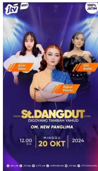
Gambar 2.14. Poster Stasiun Dangdut

penikmat musik. Stasiun dangdut tayang setiap hari pukul 12.00 - 13.00.