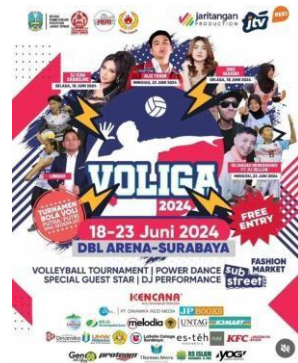
Gambar 2.27. Poster Voliga

Voliga merupakan suatu event perlombaan voli yang diadakan oleh PT. Jawapos Media Televisi (JTV). Perlombaan ini diperuntukkan bagi pelajar SMA/SMK di wilayah Jawa Timur. Event Voliga ini berlangsung dari tanggal 18 hingga 23 Juni 2024 dan diikuti oleh 48 tim.