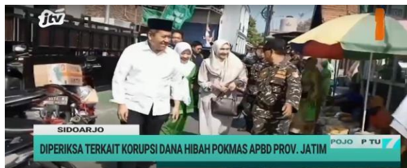
Gambar 2.10. Tayangan Program Pojok Pitu

Pojok pitu merupakan program harian yang menyajikan informasi terbaru, terhangat dan teraktual yang terjadi di Jawa Timur. Pojok pitu merupakan kumpulan berita-berita pilihan dan terbaik yang dikemas secara apik dalam sebuah program berita. Pojok pitu ditayangkan setiap hari senin hingga sabtu, dengan jam tayang pukul 19.00 - 20.00.