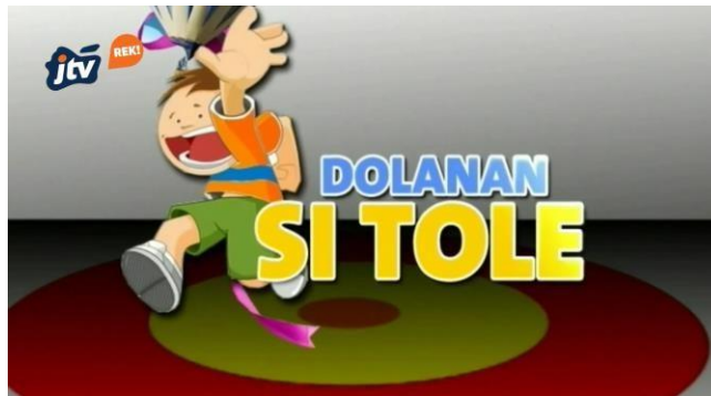
Gambar 2.17. Logo Dolanan Si Tole

Dolanan Si Tole merupakan program yang mengangkat cerita tentang kehidupan dan budaya masyarakat, khususnya yang berkaitan dengan tradisi dan kearifan lokal. Program ini menampilkan berbagai macam cerita dari kehidupan anak-anak dan remaja, serta mengajak penonton untuk mengenal lebih dekat dengan dunia mereka melalui aktivitas bermain (dolanan) yang khas, sambil memberikan nilai-nilai positif mengenai persahabatan, kerja sama, dan pentingnya melestarikan budaya tradisional