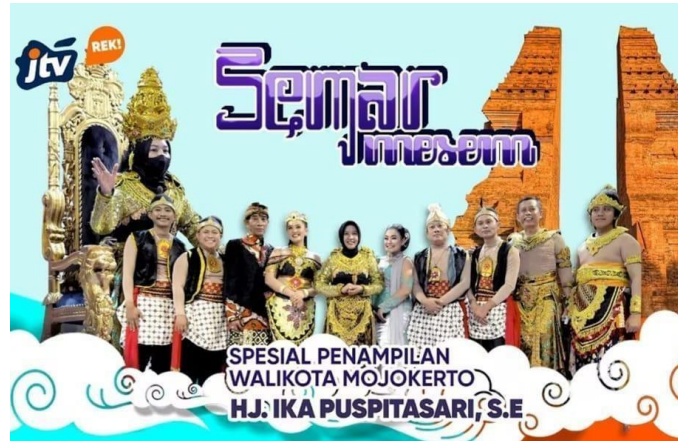
Gambar 2.16. Poster Semar Mesem