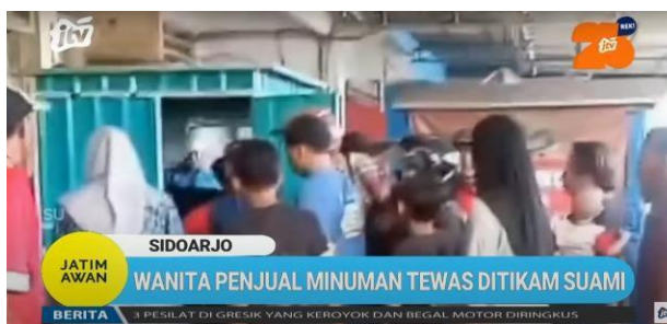
Gambar 2.6. Tampilan Program Jatim Awan

Jatim Awan merupakan program berita harian yang menyajikan informasi terbaru di Jawa Timur dengan mengedepankan konsep berita soft news. Jatim Awan disiarkan secara live setiap hari senin hingga sabtu, dengan jam tayang pukul 11.30 - 12.00.