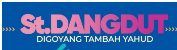
Gambar 2.13. Logo Stasiun Dangdut

Stasiun Dangdut merupakan program yang lahir untuk memberikan hiburan segar sekaligus menjadi wadah bagi kreativitas para seniman orkes melayu. Genre musik dangdut, yang telah menjadi bagian tak terpisahkan dari budaya musik Indonesia, terus berkembang dan terbuka terhadap pengaruh musik lainnya, mulai dari keroncong, langgam, degung, gambus. hingga aliran musik modern seperti rock, pop, house music . Dengan keberagaman pengaruh tersebut, Stasiun dangdut hadir untuk menghidupkan kembali semangat dangdut dengan sentuhan yang lebih inovatif dan relevan bagi berbagai kalangan