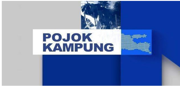
Gambar 2.7. Logo program Pojok Kampung

Pojok kampung merupakan program berita harian yang menggunakan bahasa khas suroboyoan, diselingi dengan parikan pada setiap segmen. Pojok kampung juga menyajikan segmen berita dalam bahasa daerah, seperti Pojok Madura, Pojok Kulonan, dan Pojok Osing. Pojok kampung ditayangkan secara langsung setiap hari senin hingga sabtu, dengan jam tayang pukul 21.00 - 22.00, Khusus hari minggu pojok kampung tayang pukul 21.00-21.30.