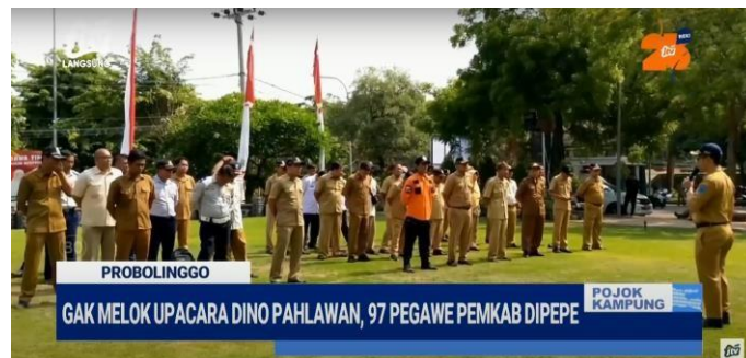
Gambar 2.8. Tampilan Program Pojok Kampung

Pojok kampung merupakan program berita harian yang menggunakan bahasa khas suroboyoan, diselingi dengan parikan pada setiap segmen. Pojok kampung juga menyajikan segmen berita dalam bahasa daerah, seperti Pojok Madura, Pojok Kulonan, dan Pojok Osing. Pojok kampung ditayangkan secara langsung setiap hari senin hingga sabtu, dengan jam tayang pukul 21.00 - 22.00, Khusus hari minggu pojok kampung tayang pukul 21.00-21.30.