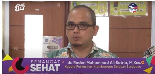
Gambar 2.22. Tampilan Semangat Sehat

Semangat Sehat merupakan program yang membahas berbagai topik seputar kesehatan, gaya hidup sehat, serta tips menjaga kebugaran tubuh. Program ini sangat relevan sebagai panduan bagi masyarakat yang ingin meningkatkan kualitas hidup dan mencegah berbagai penyakit.