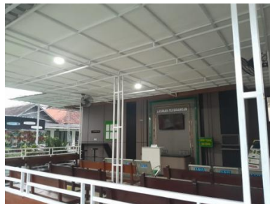
Gambar 1.3 Ruang Tunggu Sidang Pengadilan Negeri Kota Malang Kelas IA