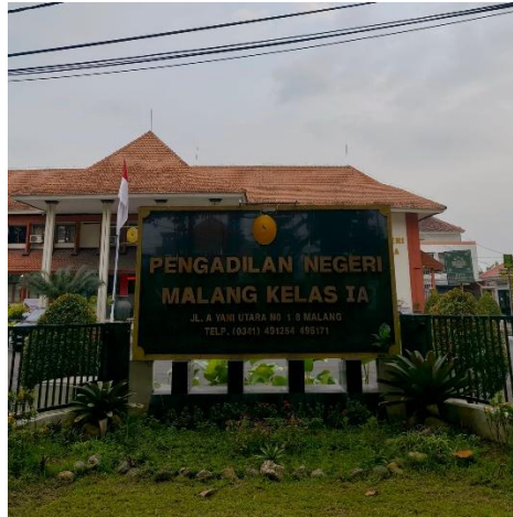
Gambar 1.1 Bagian Depan Pengadilan Negeri Kota Malang Kelas IA