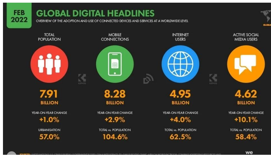
Gambar 1. 1 Digital dan Statistik Media Sosial Tahun 2022

Berdasarkan laporan We Are Social & Hootsuite (2022), tingkat penetrasi internet global telah mencapai 62,5% dari total populasi dunia yang berjumlah 7,91 miliar jiwa. Dari angka tersebut, sebanyak 4,62 miliar orang di antaranya merupakan pengguna aktif media sosial.