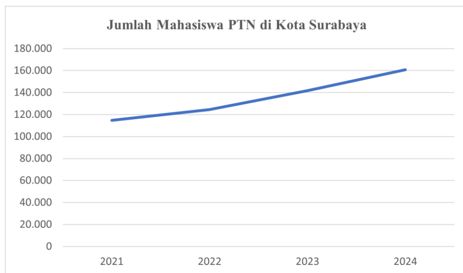
Gambar 1. 3 Jumlah Mahasiswa PTN di Kota Surabaya 2021-2024