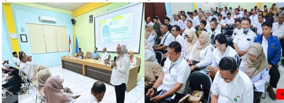
Gambar 1.3 Sosialisasi Program KRISNA

Fasilitas pendukung pembelajaran seperti papan tulis dan proyektor juga belum tersedia di lokasi, sehingga proses belajar mengajar kurang efektif dan menghambat penyampaian materi oleh tutor kepada peserta didik. Fasilitas fisik menjadi hambatan yang dapat memengaruhi implementasi program karena materi pada Paket A, B, dan C yang berbeda, sehingga membutuhkan media visual untuk membantu penjelasan. Selain itu, masih kurangnya pola komunikasi berupa sosialisasi dari Dinas Pendidikan Kota Surabaya terkait pelaksanaan dan mekanisme pembelajaran Program KRISNA kepada kelompok sasaran. Sosialisasi memang sudah dilaksanakan, tetapi belum optimal.