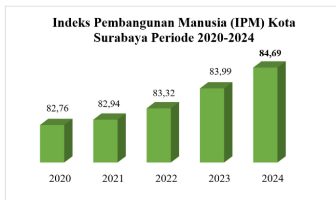
Gambar 1.2 IPM Kota Surabaya Periode 2020-2024

82,67, dan Kota Mojokerto sebesar 81,76. Capaian IPM Kota Surabaya tersebut menunjukkan peningkatan yang terjadi pada seluruh dimensi IPM, sehingga mencerminkan keberhasilan pelaksanaan program pembangunan di berbagai sektor (Badan Pusat Statistik Kota Surabaya, 2024). Perkembangan IPM Kota Surabaya dapat dilihat lebih rinci jika dibandingkan dengan tren pertumbuhan IPM Kota Surabaya selama lima tahun terakhir, sebagaimana disajikan pada data berikut ini: