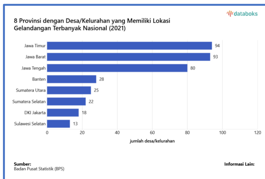
Gambar 1.1 Provinsi dengan Desa/Kelurahan yang Memiliki Lokasi Gelandangan Terbanyak Nasional (2021)

Pada era globalisasi dan di tengah situasi krisis yang melanda Indonesia, berbagai permasalahan kesejahteraan sosial di masyarakat mengalami peningkatan yang cukup signifikan. Kondisi tersebut berdampak pada bertambahnya jumlah individu atau kelompok yang tergolong sebagai Pemerlu Pelayanan Kesejahteraan Sosial (PPKS).