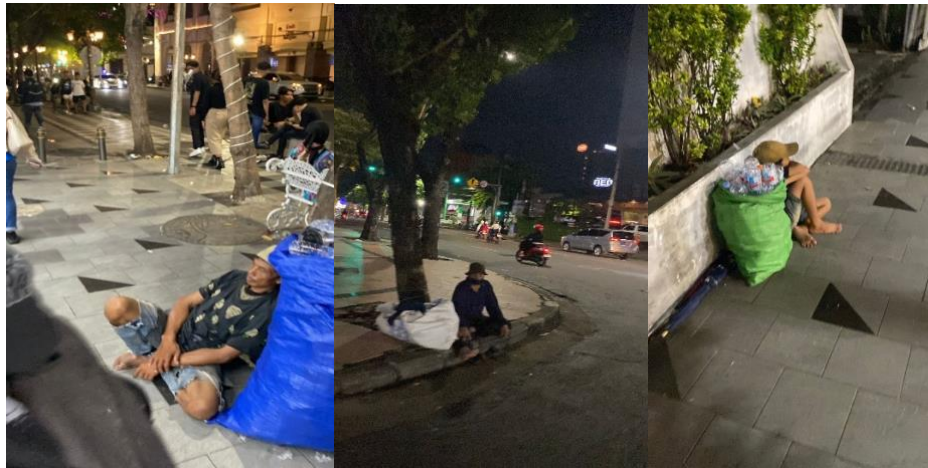
Gambar 1.3 Potret gepeng yang ada di Kota Surabaya