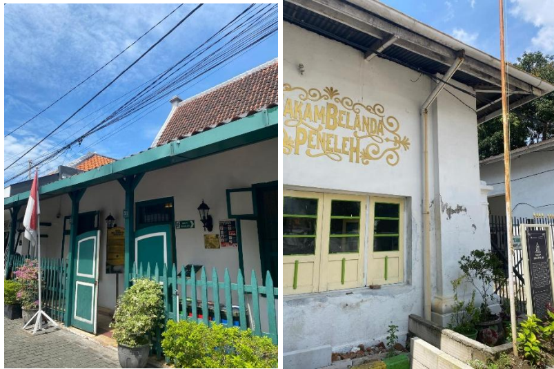
Gambar 1. 4 Kampung Peneleh Heritage