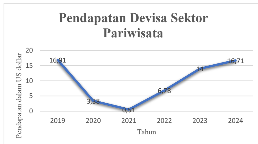
Gambar 1.1 Jumlah Devisa Pariwisata Indonesia Tahun 2019-2024