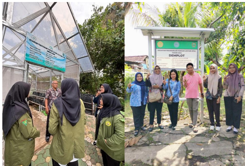
Gambar 1.2 Survei Awal Kelompok P2L

tidak memiliki demplot pada pekarangannya. Pada indikator kelengkapan administrasi, jumlah kelompok dengan kondisi optimal tercatat sebanyak 31 kelompok atau 53,45%, sedangkan 27 kelompok atau 46,55% masih berada pada kondisi tidak optimal. Artinya, sebanyak 31 kelompok P2L telah mengisi buku administrasi dengan baik, seperti buku admin, buku kas, dan buku panen, sedangkan 27 kelompok lainnya tidak mengisi buku administrasi dengan lengkap. Sementara itu, pada indikator status keaktifan anggota, sebanyak 28 kelompok atau 48,28% berada pada kondisi optimal, sedangkan 30 kelompok atau 51,72% menunjukkan tingkat keaktifan yang belum optimal. Artinya, hanya 28 kelompok P2L yang anggotanya masih aktif untuk menjalankan program P2L hingga saat ini, sedangkan 30 kelompok lainnya anggota kelompoknya tidak aktif dalam menjalankan program P2L. Jika dilihat secara keseluruhan dari empat indikator kondisi kelompok P2L, sebanyak 58,62% dari total kelompok P2L berada pada kategori optimal, sedangkan 41,38% kelompok P2L di Kota Madiun masih belum optimal.