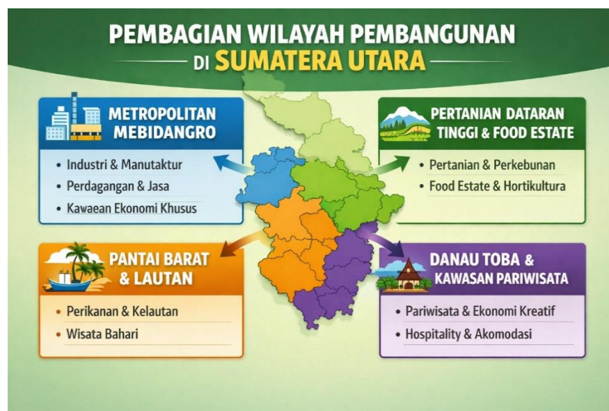
Gambar 1.2 Pembagian Wilayah Pembangunan di Sumatera Utara