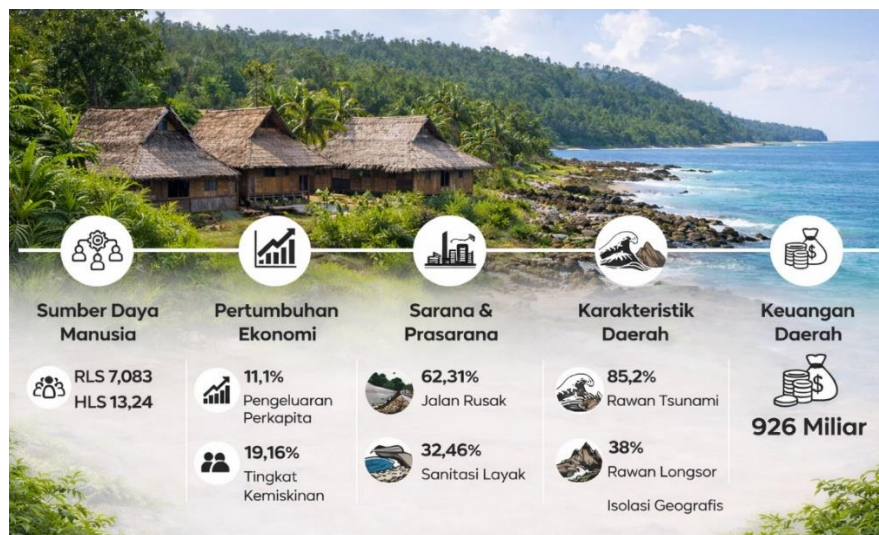
Gambar 1.3 Penyebab Keteringgalan Kepulauan Nias