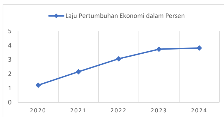
Gambar 1.4 Rata-Rata Laju Pertumbuhan Ekonomi Kepulauan Nias