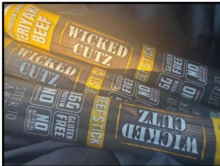
Gambar 1. 5 Label Gluten Free Pada Produk Pangan Steak Daging *Sumber: Putusan Pengadilan Distrik Amerika Serikat.

Perusahaan Frickenschmidt Foods LLC menarik kembali produk stik daging karena adanya label makanan yang tidak sesuai dengan keadaan sebenarnya. 7 Produk yang dipasarkan menggunakan label gluten free , namun mencantumkan adanya gandum dalam daftar bahan-bahan produk. Pelaku usaha memanfaatkan tingginya permintaan konsumen mengenai produk gluten free yang berfokus pada kesehatan konsumen dengan memasarkan steak daging sapi teriyaki wicked cuts dengan memberikan label dan mengiklankan sebagai produk makanan gluten free . Pelaku usaha gagal untuk membuktikan bahwa produknya bebas gluten.