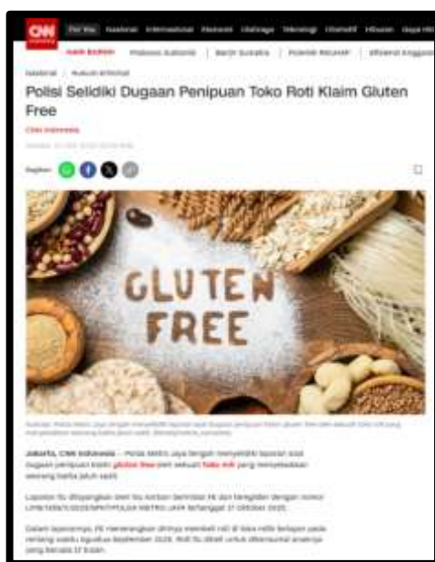
Gambar 1. 1 Toko Roti Gluten Free

Kasus pertama berangkat dari kasus Toko Roti Bake n Grind yang berjualan secara online melalui platform Instagram, dengan klaim palsu seperti bebas gluten, bebas susu dan lain sebagainya. Banyak pihak dirugikan dari kasus ini, diantaranya yaitu individu dengan masalah kesehatan seperti alergi makanan, kanker, autoimun ( celiac ), intoleransi gluten, dan ADHD ( Attention Deficit Hyperactivity Disorder ) merupakan pihak-pihak rentan yang paling dirugikan. Masyarakat umum juga merasa dirugikan, karena menurunkan kepercayaan publik terhadap produk makanan khusus yang diperjualbelikan melalui e-commerce . Tidak hanya itu, pelaku usaha atau brand asli yang produknya dikemas ulang menjadi produk gluten free oleh Toko Roti Bake n Grind juga mengalami kerugian immateriil berupa reputasi dan kepercayaan, kemudian kerugian materiil berupa kehilangan pendapatan dan biaya hukum.