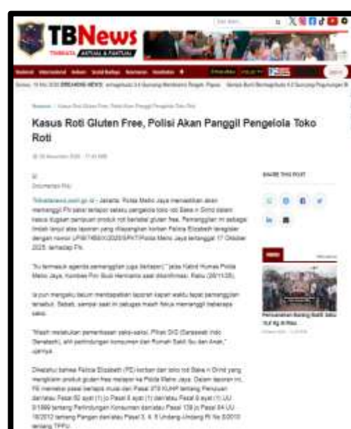
Gambar 1. 2 Kasus Roti Gluten Free