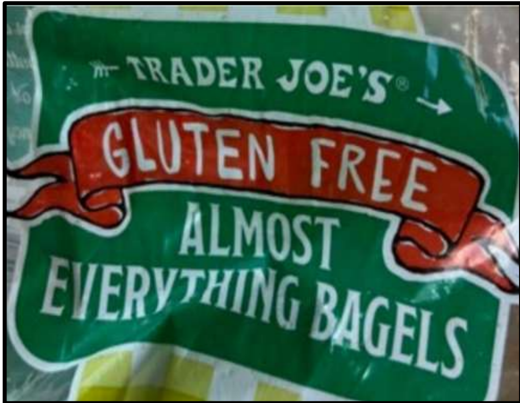
Gambar 1. 4 Label Produk Trader Joe's

Konsumen menganggap makanan bebas gluten lebih sehat dan rendah kalori, mengingat keyakinan konsumen terhadap makanan dengan label gluten free pada produk almost everything bagels dari Trader Joe's , mendorong konsumen menentukan pilihan untuk membeli produk tersebut. Berdasarkan kasus tersebut, Trader Joe's yang diuji oleh Health Research Institute sebuah laboratorium klinis dan analitik terakreditasi sesuai dengan tes AgraQuant Gluten G12 ELISA , menunjukkan produk dari perusahaan Trader Joe's mengandung gluten yang sangat tinggi. 5