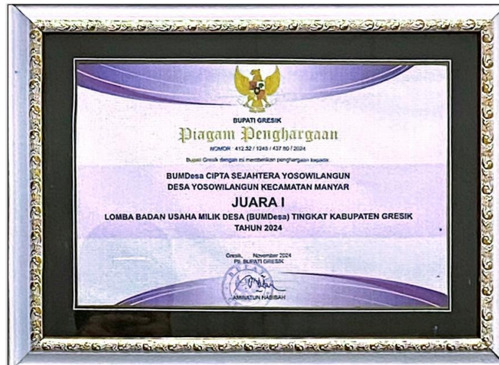
Gambar 1.4 Piagam Penghargaan

BUMDesa Cipta Sejahtera kembali mendapatkan penghargaan se-Jawa Timur, yaitu Juara 1 Kategori Unik dan Inovatif, dalam Lomba BUMDesa Provinsi Jawa Timur 2025 yang digelar oleh Dinas Pemberdayaan Masyarakat dan Desa (DPMD) Jawa Timur. Mengutip dari Gresiksatu.com , Kepala Desa Yosowilangun bersama Direktur BUMDesa Cipta Sejahtera menyampaikan bahwa keberhasilan tersebut merupakan hasil kerja bersama seluruh elemen desa yang berani melakukan inovasi dan terbuka terhadap peluang baru. Oleh karena itu, Desa Yosowilangun menargetkan diri sebagai desa yang mandiri secara ekonomi, tidak hanya menjalankan program yang bersifat seremonial.