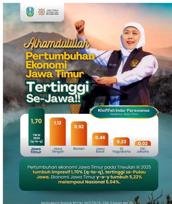
Gambar 1.1 Pertumbuhan Ekonomi di Pulau Jawa

Jawa Timur adalah provinsi terluas dan memiliki pertumbuhan perekonomian tertinggi di Pulau Jawa (Ardliyanto, 2026). Provinsi ini kembali menunjukkan perannya sebagai salah satu penopang utama perekonomian nasional, dengan tren pertumbuhan yang tetap terjaga hingga akhir 2025 dan memberi optimisme memasuki 2026. Mengutip dari Infopublik.id, sektor manufaktur terus mendominasi perekonomian Jawa Timur, menyumbang 31,42 persen dari total, diikuti oleh perdagangan grosir dan ritel, bengkel mobil dan sepeda motor (18,70 persen), kehutanan, pertanian, serta perikanan (10,22 persen), dan konstruksi (8,49 persen). Sebanyak 68,83 persen perekonomian Jawa Timur berasal dari keempat sektor ini (BPS Jawa Timur, 2025). Situasi ini menunjukkan bahwa pertumbuhan sektor industri berperan vital dalam perkembangan perekonomian Provinsi Jawa Timur.