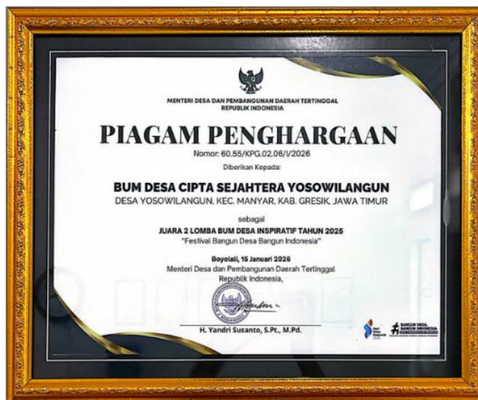
Gambar 1.6 Piagam Penghargaan

tata kelola usaha, keberlanjutan program, serta dampak positif yang dirasakan langsung oleh masyarakat desa (Desa Yosowilangun, 2026).