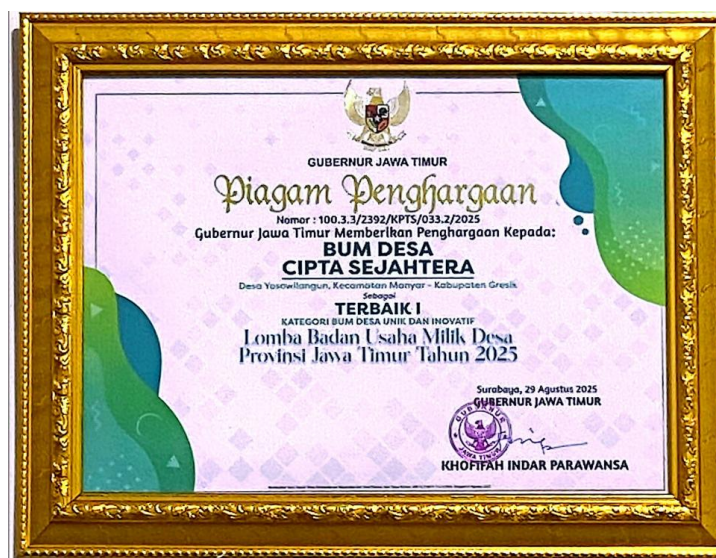
Gambar 1.5 Piagam Penghargaan

JATIMTIMES - Prestasi ini merupakan kelanjutan dari kesuksesan sebelumnya di mana Badan Usaha Milik Desa Cipta Sejahtera (BUMDesa) meraih juara pertama di tingkat Kabupaten Gresik. BUMDesa melaju ke final nasional setelah memenangkan kejuaraan tingkat provinsi, namun konfirmasi resmi dari pemerintah pusat mengenai pemenang nasional masih ditunggu. Atas capaian tersebut, BUMDesa Cipta Sejahtera kini menjadi salah satu contoh pengelolaan BUMDesa yang mengedepankan pembaruan dan kerja sama.