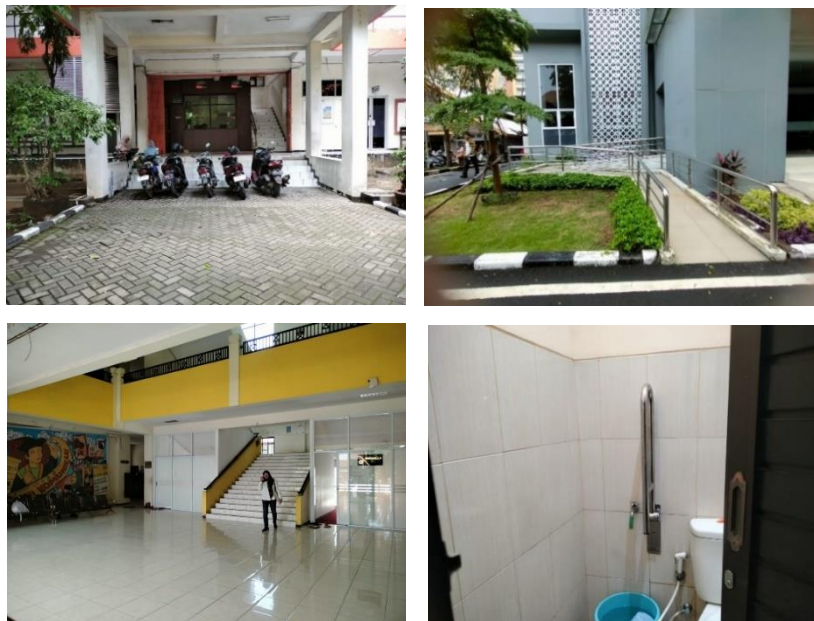
Gambar 1. 4 Sarana dan Prasarana Umum Sumber: Diolah Oleh Penulis, 2025

Dalam dokumen Renstra UPN “Veteran” Jawa Timur, dijelaskan bahwa pengembangan sarana dan prasarana merupakan aspek penting yang tercantum dalam misi ke-5 universitas yaitu meningkatkan sistem pengelolaan sarana dan prasarana terpadu serta menyediakan infrastruktur dan fasilitas pendidikan yang modern dan mendukung kebutuhan inklusi. Arah pengembangan tersebut meliputi penyediaan sarana dan prasarana yang ramah bagi mahasiswa dengan disabilitas yang merupakan bagian dari usaha agar terciptanya lingkungan belajar yang terbuka dan setara. Komitmen ini menunjukkan bahwa aspek aksesibilitas dan pemenuhan kebutuhan mahasiswa penyandang disabilitas termasuk ke dalam bagian dari arah pengembangan universitas dalam pengembangan infrastruktur kampus. Strategi ini bertujuan agar universitas dapat menyediakan fasilitas kebutuhan inklusi secara menyeluruh di lingkungan universitas sehingga dapat mendukung komitmen universitas untuk menjadi kampus yang inklusi.