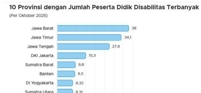
Gambar 1. 2 10 Provinsi Dengan Jumlah Pseserta Didik Disabilitas Terbanyak

Akibat dari hal tersebut, para penyandang disabilitas masih merasakan berbagai hambatan dalam pelaksanaan perkuliahan karena terhambat akses fisik, prosedur administrasi dan kurangnya pendampingan akademik. Kondisi ini dapat membuat peluang mereka untuk memasuki tingkat pendidikan yang lebih tinggi jauh lebih kecil dibandingkan mahasiswa non-disabilitas.