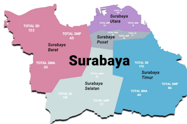
Gambar 1. 3 Persebaran SD, SMP, SMA di Kota Surabaya Sumber: (BPS-Statistics Indonesia Surabaya, 2024)

Melalui hal ini, dapat dilihat bahwa penurunan partisipasi sekolah pada jenjang menengah erat kaitannya dengan kondisi sosial ekonomi masyarakat. Berdasarkan fenomena sebelumnya pula, memperkuat bahwa persoalan putus sekolah tidak hanya dipengaruhi oleh kemampuan ekonomi keluarga, tetapi juga oleh ketersediaan dan keterjangkauan fasilitas pendidikan di wilayah tempat tinggal anak, yang salah satunya tercermin dari persebaran sekolah pada tiap jenjang pendidikan.