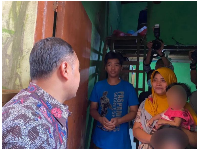
Gambar 1. 2 Potret Kasus Anak Putus Sekolah di Surabaya

laporan tersebut, keluarga dengan enam anak di wilayah Surabaya yang empat di antaranya terpaksa berhenti sekolah karena tidak mampu memenuhi kebutuhan dasar pendidikan.