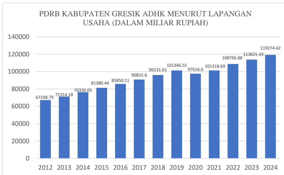
Gambar 1. 1 Grafik PDRB Atas Dasar Harga Konstan Menurut Lapangan Usaha Kabupaten Gresik