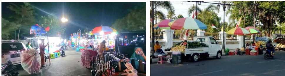
Gambar 1. 2 Kondisi PKL sebelum di relokasi

Sentra PKL Food Colony bukan satu-satunya sentra PKL di Pamekasan, terdapat beberapa sentra PKL lainnya yang telah beroperasi terlebih dahulu daripada Food Colony . Antara lain Sae Salera yang telah beroperasi sejak tahun 2010 dengan jumlah 60 pedagang, sentra eks PJK yang diresmikan pada tahun 2018 dan menampung 74 pedagang, serta sentra Sae Rassa yang disahkan pada tahun 2023 dengan jumlah 63 pedagang.