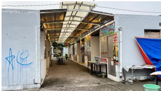
Gambar 1. 3 Kondisi PKL di Food Colony

“Saya awalnya jualan di Arek Lancor, kemudian dipindah ke sini, setelah dipindah disini penjualan saya menurun, kalau ada yang beli aja sudah Alhamdulillah, banyak pedagang lain yang pindah, makanya ini banyak kios tutup.” (Hasil wawancara Desember 2025)