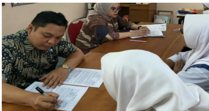
Gambar 1.2 Pelaksanaan Program SALAM

Penyalahgunaan dan Peredaran Gelap Narkotika dan Prekursor Narkotika berbasis pendidikan dan kemampuan implementasi di lapangan. Hambatan utama yang teridentifikasi mencakup ketidakkonsistenan standar perizinan pihak sekolah, kurangnya pemahaman guru tentang mekanisme rehabilitasi, resistensi pihak sekolah dan orang tua mengenai kekhawatiran stigma, dan ketakutan anak yang akan dikeluarkan dari sekolah atau dilaporkan ke polisi. Temuan-temuan tersebut menegaskan perlunya penilaian empiris terhadap kualitas implementasi, faktor pendukung dan penghambat, serta persepsi siswa agar strategi deteksi dini benar-benar operasional dan diterima di lingkungan sekolah.