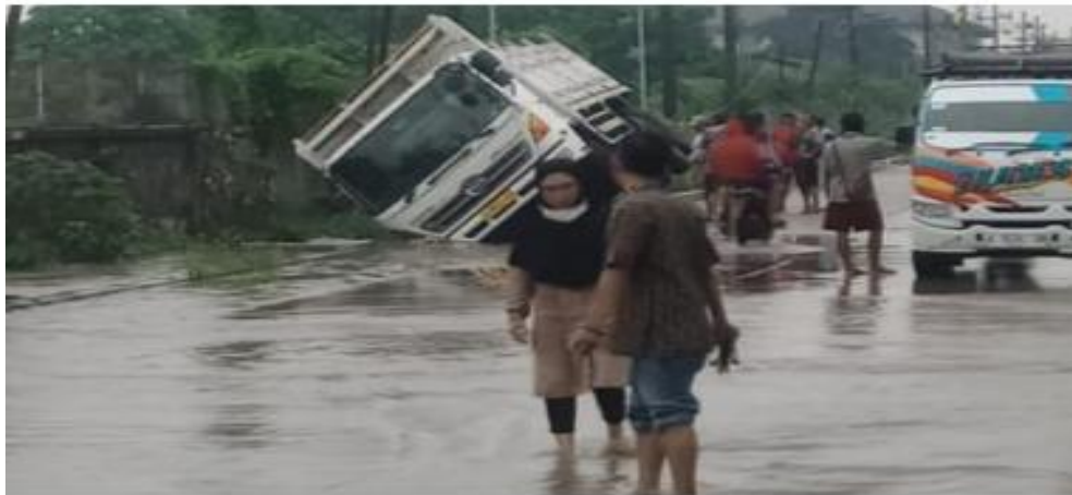
Sebuah truk terperosok ke selokan lantaran jalan Sumpit, Gresik terendam banjir.