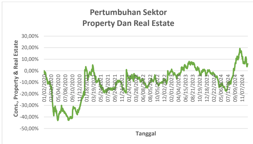
Gambar 1. 2 Grafik Pertumbuhan Sektor Properti dan Real Estate 2020-2024