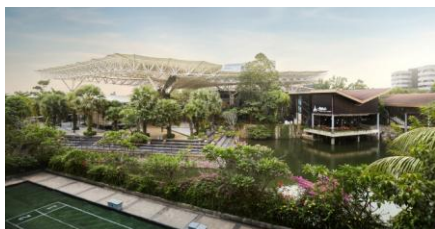
Gambar 1.1 The Breeze BSD City