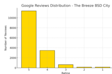
Gambar 1.2 Google Reviews The Breeze BSD City