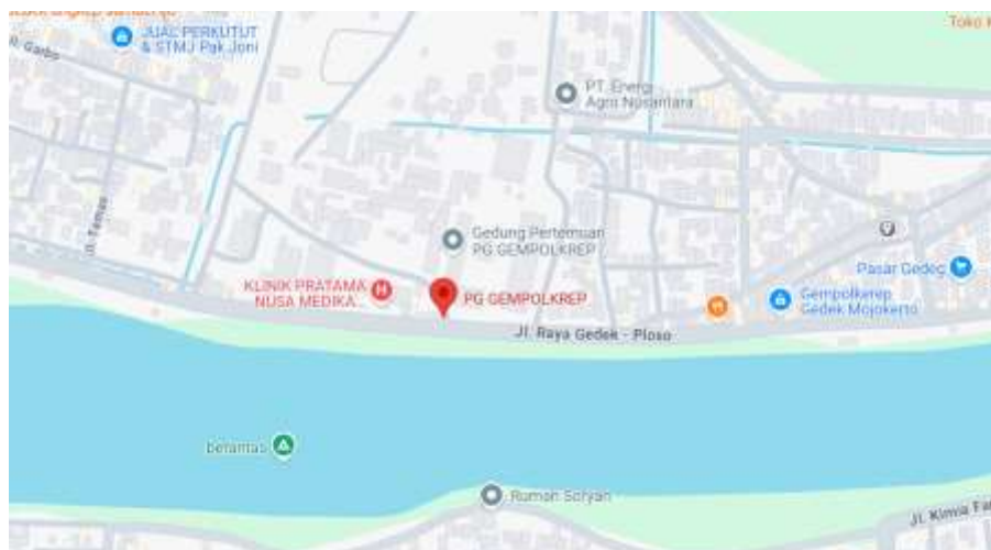
Gambar 1. 1 Lokasi PG Gempolkrep