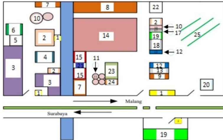
Gambar I.1 Tata Letak Pabrik PT Pabrik Gula Candi Baru