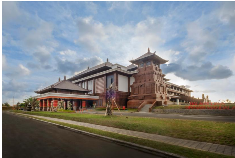
Gambar 1. 1 Balai Budaya Giri Nata Mandala

modern, sehingga menjadi pusat kesenian yang tidak hanya berfungsi sebagai ruang pertunjukan, tetapi juga simbol identitas budaya daerah. Dengan demikian, gedung kesenian yang dirancang melalui prinsip neo-vernakular tidak semata-mata menjadi tempat pertunjukan, melainkan juga sebuah ikon budaya yang mampu menciptakan kedekatan emosional dengan masyarakat. Penerapan arsitektur neo-vernakular memungkinkan lahirnya bangunan yang kontekstual, berakar pada tradisi Sunda, namun tetap fungsional, modern, dan berdaya tarik bagi generasi muda.