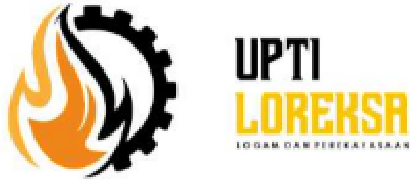
Gambar 2.1 Logo UPTI Logam dan Perekayasaan