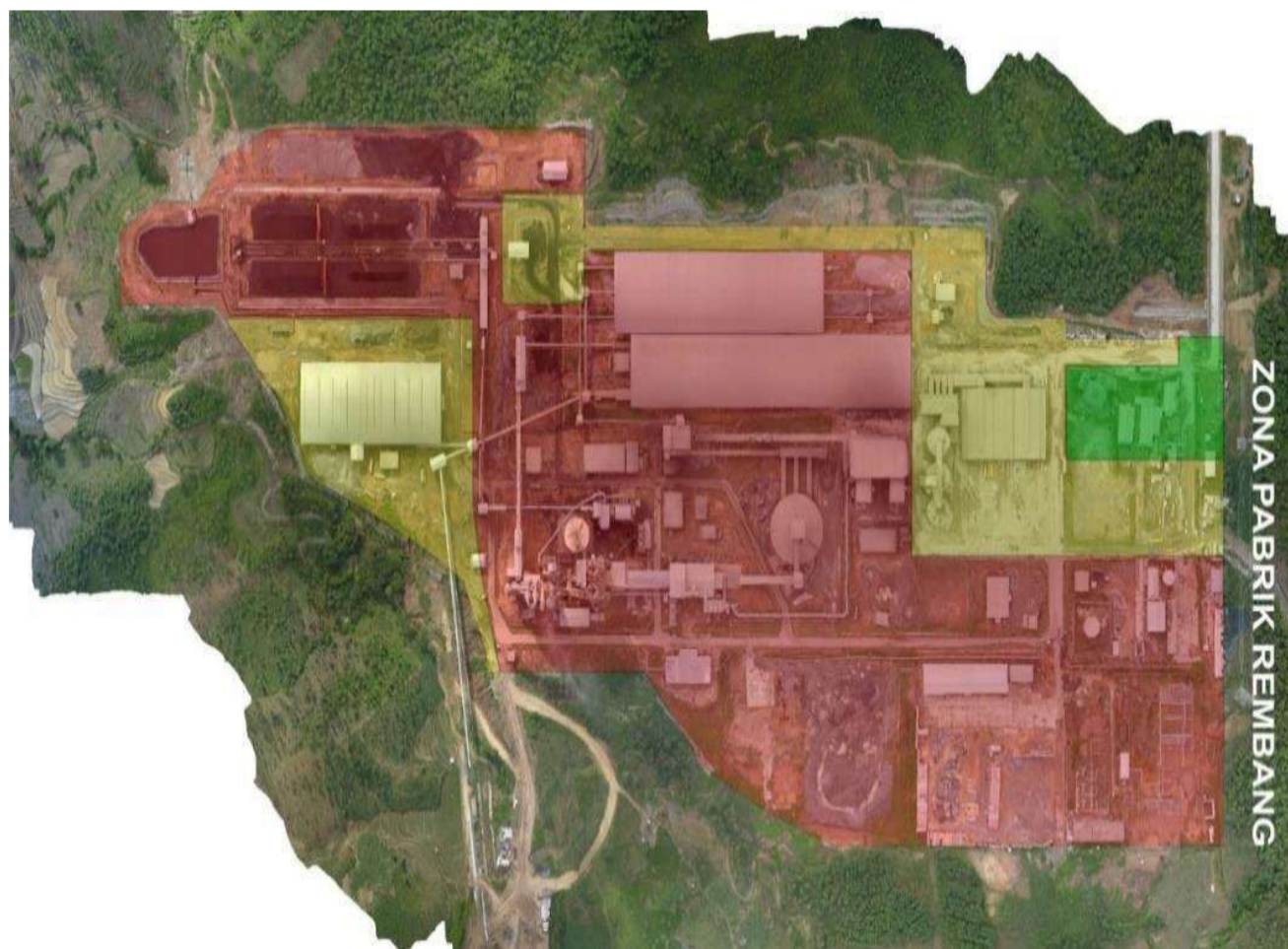
Gambar I. 2 Peta Lokasi PT Semen Gresik (Persero) Tbk Pabrik Rembang

seperti debu yang dihasilkan pabrik yang tidak tertangkap alat penangkap debu dapat membahayakan kesehatan masyarakat Kota Gresik maupun tambang yang tidak mencukupi untuk beroperasinya pabrik pengolahan semen. Oleh karena itu, pabrik Semen Gresik dibangun di Desa Kajar, Kecamatan Gunem, Kabupaten Rembang, Jawa Tengah. PT. Semen Gresik Rembang terletak pada lokasi yang strategis dengan penduduk yang berada di lokasi tersebut masih jarang sehingga permasalahan polusi udara oleh debu tidak menjadi masalah kesehatan yang serius. Selain itu, beberapa pertimbangan lain seperti pemasaran yang ekonomis, bahan baku yang sangat melimpah dan pertimbangan faktor sosial yang dapat meningkatkan kesejahteraan masyarakat sekitar. Lokasi ini berjarak 26km dari kota rembang, 51km dari pelabuhan rembang, 97km dari pelabuhan pelsus tuban, 147 km dari kota Semarang dan 247 km dari kota Surabaya.