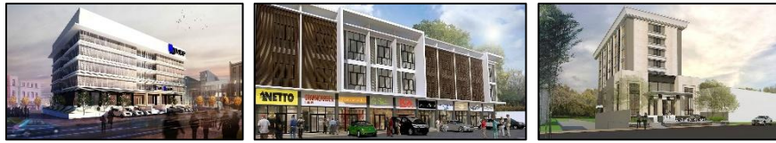
Project MDP Campus, Ruko Demang, dan Santika Hotel

dikerjakan oleh perusahaan ini adalah bangunan komersial. Berikut beberapa gambar project unggulan dari ALT Desain Lab: