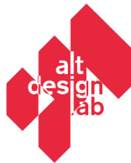
Gambar 1. 2 Logo PT. ALT Desain Teknindo

Keunggulan dari ALT Desain Teknindo terletak pada kemampuannya menjawab kebutuhan desain yang kompleks secara teknis dan estetis. Dengan visi "Together, We Shape a Better World" , perusahaan ini berkomitmen untuk mengantarkan proyek yang berkualitas tinggi dan solusi desain inovatif. Misi perusahaan mencakup menggabungkan keahlian lintas disiplin untuk memberikan pemikiran desain kreatif sesuai kebutuhan klien; menerapkan proses berbasis riset demi desain yang efisien dan unik; membangun hubungan jangka panjang yang baik dengan klien; serta mendukung pengembangan karyawan melalui pembelajaran, pertumbuhan, dan penghargaan dalam mengejar keunggulan desain.