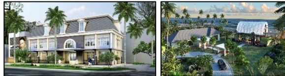
Project CM Seminary dan Mekaki Bay Marketing Gallery