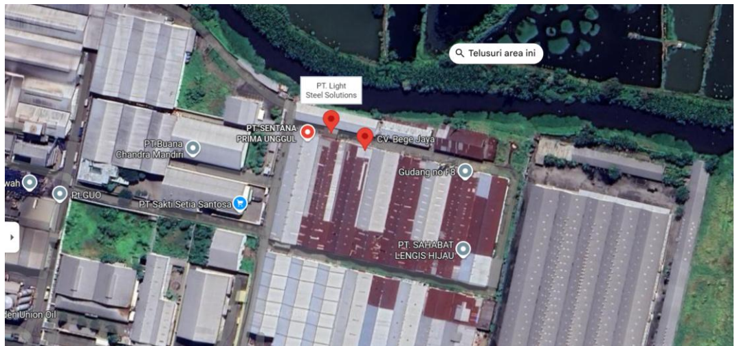
Gambar 2. 3 Lokasi Mitra

Pergudangan Tambak Sawah Blok F-3 Kec. Waru, Kab. Sidoarjo, Jawa Timur.