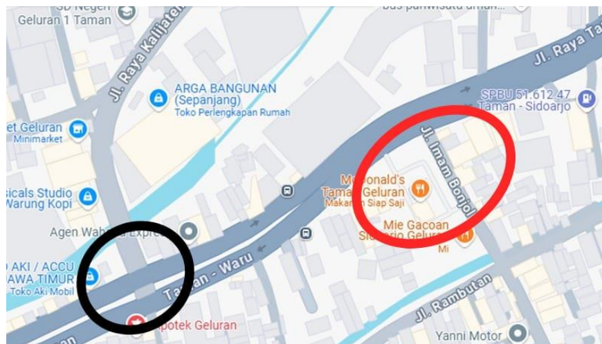
Gambar 1. 1 Lokasi penelitian

Pemilihan lokasi berikut didasarkan di karakteristik wilayah yang ialah jalur penghubung di tengah kawasan permukiman, pusat komersial, serta area perindustrian. Kepadatan kegiatan ekonomi serta mobilitas masyarakat yang tinggi di sepanjang koridor berikut mengakibatkan munculnya titik-titik simpang dengan arus hilir mudik padat serta tundaan yang signifikan. Maka dari hal tersebut, lokasi berikut dipandang relevan guna di analisa guna mendapatkan informasi cara kerja simpang serta menyusun rekomendasi perbaikan yang berbasis data. Peta lokasi penelitian guna simpang bersinyal serta simpang tak bersinyal bisa disajikan di gambar 1.1 seperti berikut: