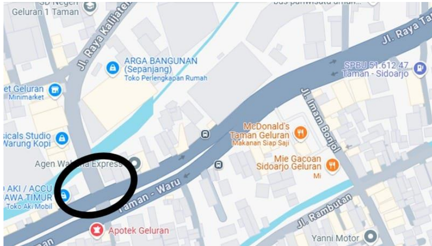
Gambar 1. 2 Lokasi Simpang Bersinyal

Peta lokasi simpang bersinyal Jalan Raya Kalijaten–Taman–Waru Sidoarjo (akses industri serta permukiman) disajikan di gambar 1.2 seperti berikut: