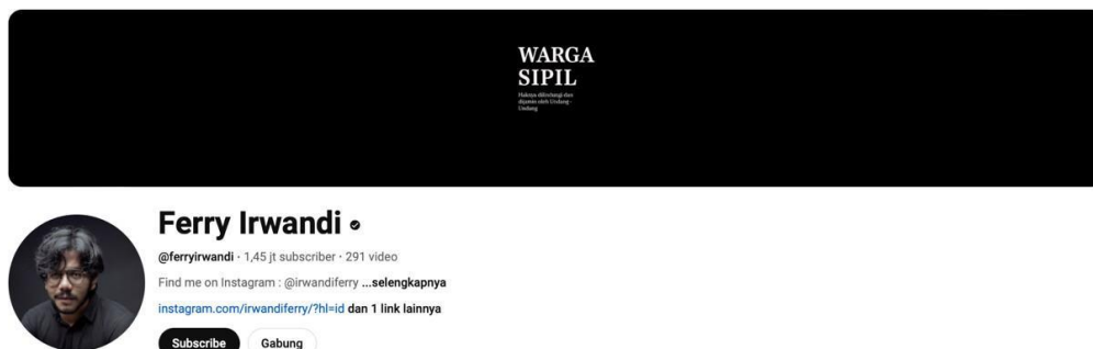
Gambar 1. 1 Channel YouTube Ferry Irwandi

Ferry Irwandi, seorang kreator konten dan mantan pegawai negeri sipil di Kementerian Keuangan, dikenal karena sikap skeptisnya terhadap praktik mistis seperti santet. Pada 19 Oktober 2024, melalui akun media sosialnya, Ferry secara terbuka menantang para dukun untuk membuktikan kemampuan mereka dengan menyantet (Pawenang, 2024). Tantangan ini memicu berbagai respons, termasuk dari Ria Puspita, seorang mantan praktisi santet, yang menerima tantangan tersebut namun kemudian mengancam akan membunuh Ferry secara langsung alih-alih melalui santet. Aksi berani Ferry ini menarik perhatian publik dan media, serta memicu diskusi luas mengenai kepercayaan terhadap praktik mistis di Indonesia (Laurent, 2024).