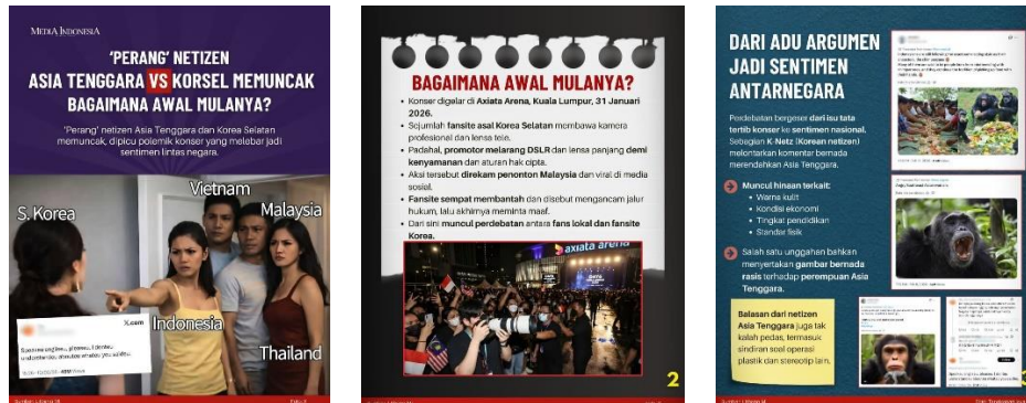
Gambar 1. 1 Awal Mula terjadinya konflik SEAblings vs K-netz

solidaritas digital dan memperkuat rasa kebanggaan nasional melalui berbagai narasi yang menampilkan citra positif negara masing-masing.