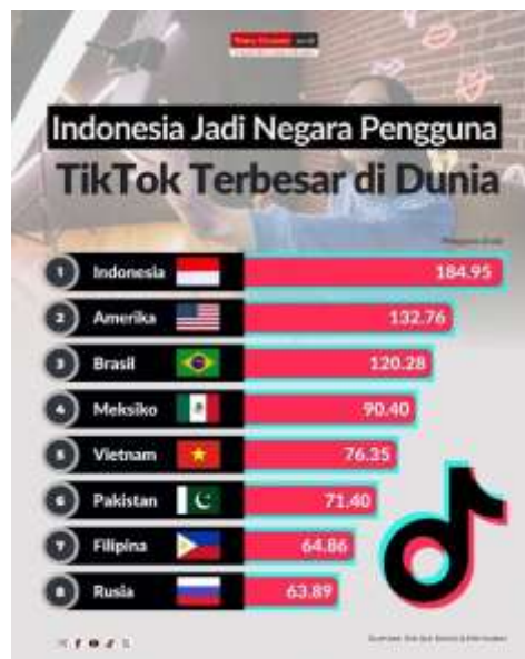
Gambar 1. 1 Negara dengan pengguna Tiktok Terbesar di Dunia

Perkembangan media sosial telah memberikan perubahan dalam cara masyarakat berinteraksi sekaligus mengakses berbagai informasi. Media sosial tidak hanya digunakan sebagai sarana komunikasi dan hiburan, tetapi juga menjadi ruang bagi pengguna untuk mencari referensi, membentuk opini, dan mengikuti tren yang sedang berkembang. Salah satu platform media sosial yang berkembang dengan sangat cepat adalah TikTok, yang dikenal sebagai media berbasis video pendek dengan kemampuan penyebaran konten yang luas kepada banyak pengguna.