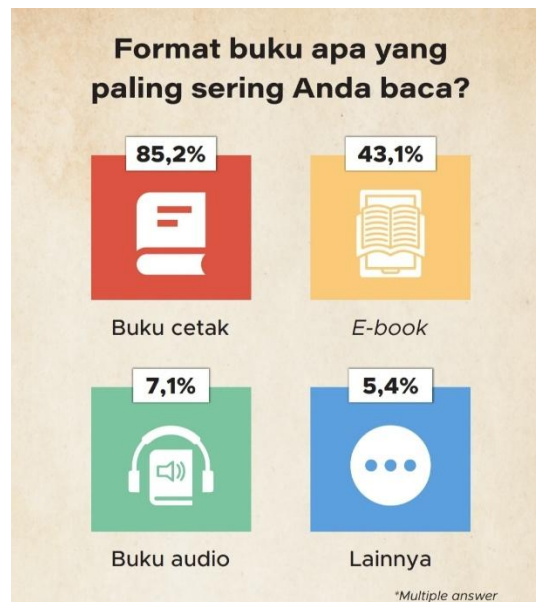
Gambar 1. 3 Format bacaan buku yang sering dibaca di Indonesia