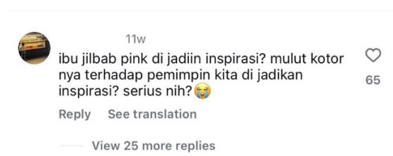
Gambar 1. 2 Komentar Makna Brave pink & Hero green di Instagram @jeromepolin