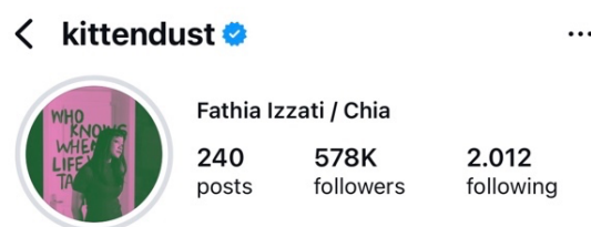
Gambar 1. 5 Foto Profil Instagram Brave pink dan Hero green @kittendust

Beredarnya awal mula postingan tuntutan 17 + 8 di akun Instagram @afutami, terlihat bahwa kombinasi warna pink hijau di gunakan dalam flyer tuntutan 17 + 8. Sampai akhirnya kedua warna tersebut di artikan sebagai brave pink dan hero green . Kedua warna tersebut kemudian dijadikan sebagai simbol solidaritas dan perlawanan selama demonstrasi yang terjadi dalam beberapa waktu terakhir. Warna pink diambil dari sosok ibu berhijab warna pink yang aksinya viral di media sosial saat melakukan demonstrasi dengan berani, menjadikan sebuah ikon optimisme dan perlawanan. Sedangkan untuk warna hijau diambil sebagai bentuk penghormatan dan rasa duka kepada driver ojol Affan yang meninggal terlindas mobil taktis milik brimob saat berlangsungnya demo (Wicaksono, 2025).