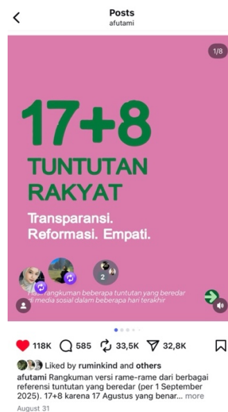
Gambar 1. 4 Postingan Instagram @afutami

vokal akan kejadian demo-demo di Indonesia, Salsa Erwina, mengatakan di wawancara bersama Kompas Newsroom bahwa ia di hubungi oleh Jerome Polin, youtuber asal Indonesia, untuk menggarap beberapa tuntutan melalui telepon selama 3 jam bersama para influencer seperti Andovi da Lopez (youtuber), Fathia Izzati (penyanyi), Abigail Limuria (aktivis), Andhyta Utami (aktivis) dan NGO ( Non-Governmental Organization ) yang ditujukan oleh pemerintah untuk rakyat Indonesia (Maharani, 2025). Akhirnya, terbentuklah tuntutan 17 + 8 yang di posting di media sosial Instagram pada tanggal 31 Agustus 2025 oleh akun @afutami dan kolaborasi dengan akun penggerak tuntutan ini lainnya.