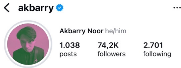
Gambar 1. 6 Foto Profil Instagram Brave pink dan Hero green @akbarry

Instagram menjadi salah satu media sosial yang menjadi wadah dalam melakukan kampanye tuntutan 17 + 8 dalam menggunakan warna pink dan hijau. Banyak akun Instagram beramai-ramai menggunakan foto profil mereka diganti menjadi latar hijau dan pink. Tak hanya foto profil, postingan maupaun template Instagram story yang berupa poster digital yang berisi tuntutan 17 + 8 pun juga menggunakan latar pink hijau. Telah dibuktikan pada sebuah penelitian bahwa sebuah warna yang dimasukkan dalam sebuah pesan politik efektif untuk digunakan (Maestre & Medero, 2024). Aksi sederhana tapi bermakna tersebut menjadi bentuk nyata dari digital activism dalam ranah media sosial yang memperluas dampak kampanye ke ruang publik digital.