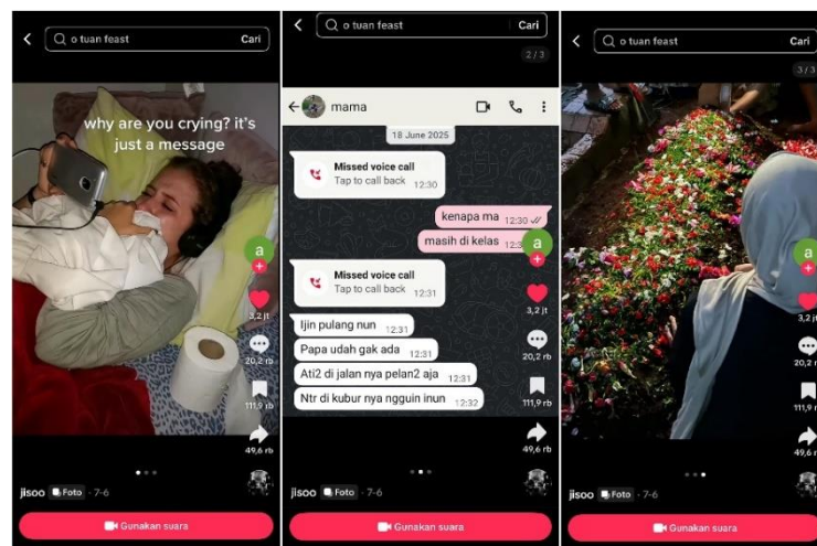
Gambar 1. 3 Salah Satu Contoh Konten Digital Grief Di TikTok @jisooaamiin

Fenomena digital grief di TikTok memperlihatkan bahwa platform ini kini berfungsi sebagai ruang publik di mana pengguna bisa mengekspresikan kesedihan dan rasa kehilangan secara kreatif. Musik, teks, dan visual digunakan sebagai sarana untuk membangun narasi emosional yang dapat dipahami dan dirasakan oleh audiens. Dengan memadukan berbagai elemen tersebut, pengguna tidak sekadar membagikan pengalaman pribadi, tetapi juga ikut membentuk makna sosial baru terkait cara berduka di era digital.