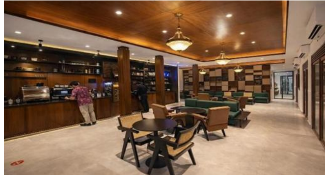
Gambar 1.1 Pelayan Sedang Menunggu Pesanan Dari Dapur Untuk Disajikan Kepada Konsumen