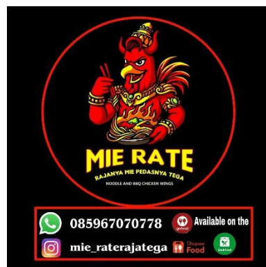
Gambar 1.1 Logo Mie Rate

Berdasarkan hasil observasi awal peneliti, sebagian konsumen mengenal produk Mie Rate melalui platform pemesanan online seperti GoFood dan ShopeeFood, meskipun belum sepenuhnya mengetahui lokasi fisik usaha secara langsung. Mie Rate telah memiliki identitas visual berupa logo merek serta secara konsisten melakukan komunikasi dengan konsumen melalui unggahan harian di WhatsApp Story untuk menginformasikan ketersediaan produk. Data tersebut mengindikasikan bahwa pengenalan merek ( Brand Awareness ) Mie Rate secara dominan dikonstruksi melalui platform digital, melampaui pengaruh dari eksistensi fisik secara konvensional.