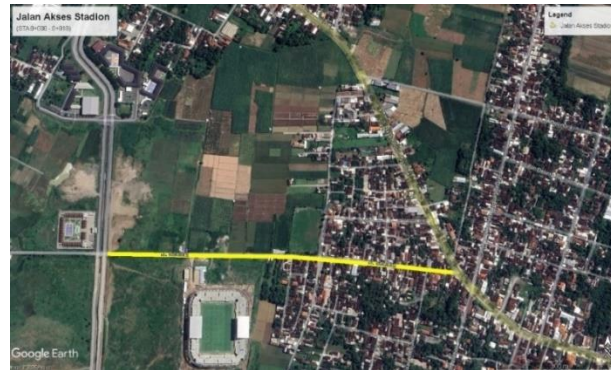
Gambar 1. 1 Peta Lokasi Paket Pekerjaan Pembangunan Jalan Akses Stadion Gelora Dhaha Jayati (STA 0+000 – 0+818)

Untuk peta lokasi Paket Pekerjaan Pembangunan Jalan Akses Stadion Gelora Dhaha Jayati ditunjukkan pada gambar 1.1.