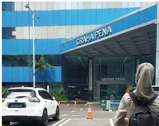
Gambar 2.1 Lokasi PT. Otak Kanan

PT. Otak Kanan merupakan sebuah perusahaan yang bergerak di bidang teknologi digital, seperti pengembangan website dan aplikasi, desain dan multimedia, digital marketing agency , edukasi serta layanan digital lainnya. Perusahaan ini didirikan pada tahun 2009 berdasarkan akta pendirian perusahaan No. 01 tanggal 21 Desember 2009 oleh Notaris Dicky Dwiharnanto, SH. di Sidoarjo. Berdasarkan Keputusan Menteri Hukum dan HAM RI dengan Nomor AHU-02110.AH.01.01. Tahun 2010 tertanggal 14 Januari 2010, serta terdaftar dalam Daftar Perseroan dengan Nomor AHU-0003117.AH.01.09. Tahun 2010 pada tanggal yang sama, perusahaan ini resmi menggunakan nama PT. Otak Kanan.