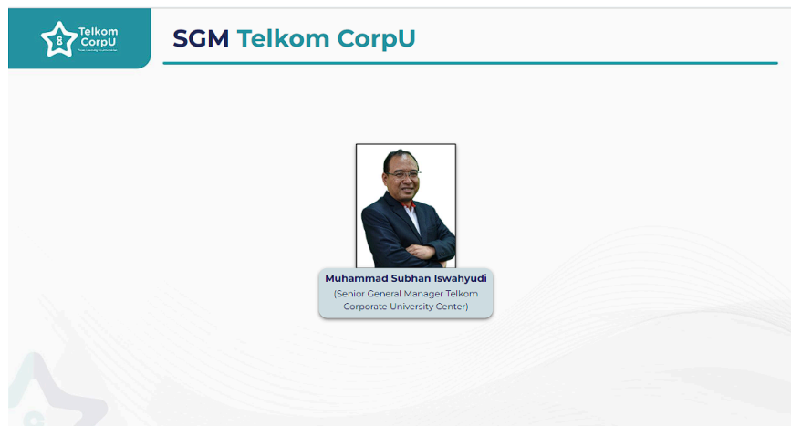
Gambar 2.2 Senior General Manager Telkom CorpU