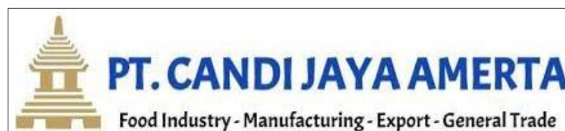
Gambar 1. Logo PT Candi Jaya Amerta

Tahun 1984, Perusahaan memperluas usahanya dengan meningkatkan kapasitas produksi dan mengembangkan varian produknya. Pada tahun 1985, perusahaan mulai merambah ke pasar internasional dengan mengekspor produk ke Arab Saudi. Perusahaan terus berkembang pesat hingga mampu menembus pasar Eropa pada tahun 1986. Aktivitas ekspor semakin meningkat ditahun berikutnya, produk di ekspor ke berbagai negara di wilayah Asia, Australia dan Eropa.