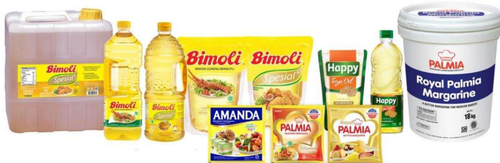
Gambar I. 1. Produk PT Salim Ivomas Pratama Tbk

Produk dari PT Salim Ivomas Pratama Tbk ialah minyak goreng nabati dengan nama merek Bimoli , Bimoli Spesial dan Happy dan produk margarin serta shortening untuk pasar konsumen dikemas dan dipasarkan dengan merek Amanda , Palma dan Royal Palma . Sedangkan produk margarin dan shortening untuk kebutuhan industri dikemas dan dipasarkan dengan merek Amanda , Delima , Malinda , Palma dan Simas . Produk minyak goreng industri dipasok secara langsung ke Indofood dan produsen makanan lainnya, sedangkan produk margarin dan shortening dipasarkan ke pelanggan confectioneries , bakeries , dan produsen makanan.