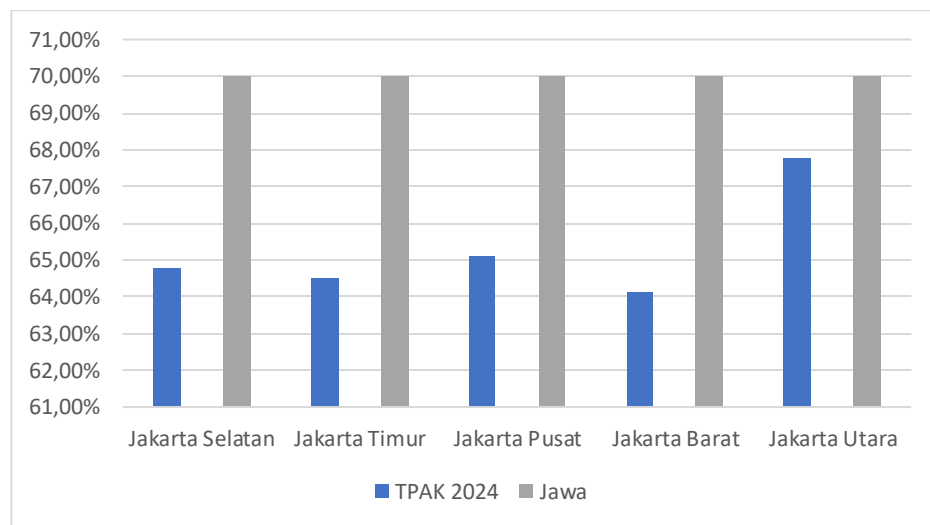
Gambar 1. 3 TPAK (%) di Wilayah DKI Jakarta Tahun 2024